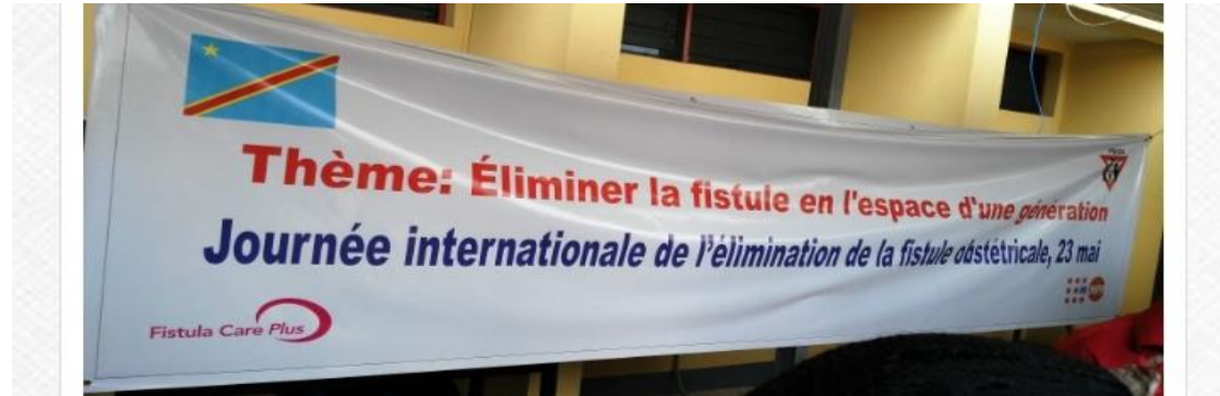
Figure 1: Banderole de façade d'une communication de l'UNFPA (Congo) lors de la journée internationale de l'élimination de la fistule obstétricale

l'hôte de réunions de parties prenantes, tout en développant ses efforts de prévention et traitement. En cette période, Fistula Care Plus figure dans 16 journaux en ligne, participe à 43 programmes radios et 04 programmes de télévision. Elle est accueillie dans 19 évènements locaux, nationaux ou internationaux prenant des formes de défilés et de conférences internationales.