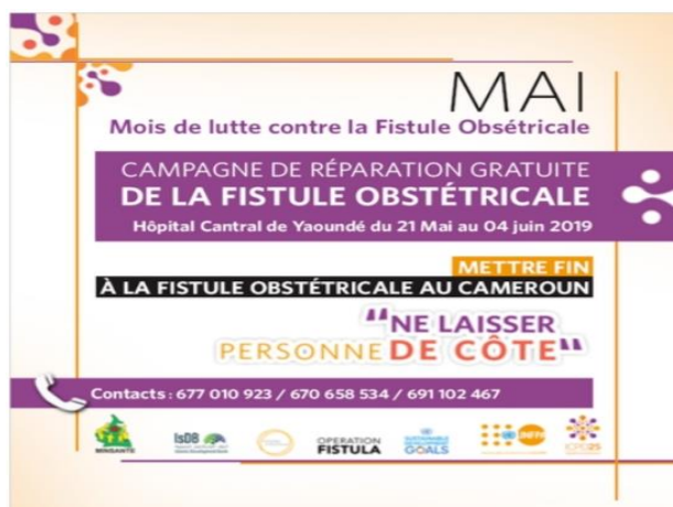
Figure 2: Bannière portant communication de l'UNFPA sur la réparation de de la fistule obstétricale