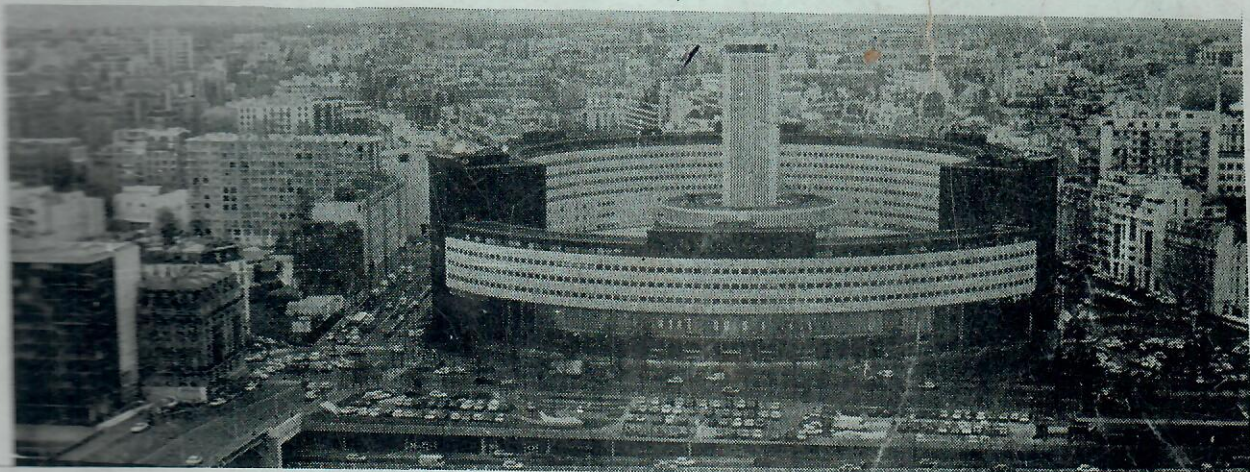
. RFI : La Radio mondiale .

Mémoire présenté et soutenu publiquement en vue de l'obtention du Diplôme des Sciences et Techniques de l'Information et de la communication ( DSTIC )