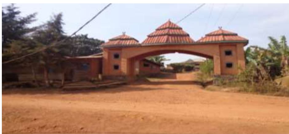
Photo 7: Le deuxième Palais Royal Ntsingbeu dirigé par Metangmo Pierre-Marie dit Fo'o Ntsalah Fo'o Nkemvou III

Source : cliché Tsiafie Christabel, Janvier 2014