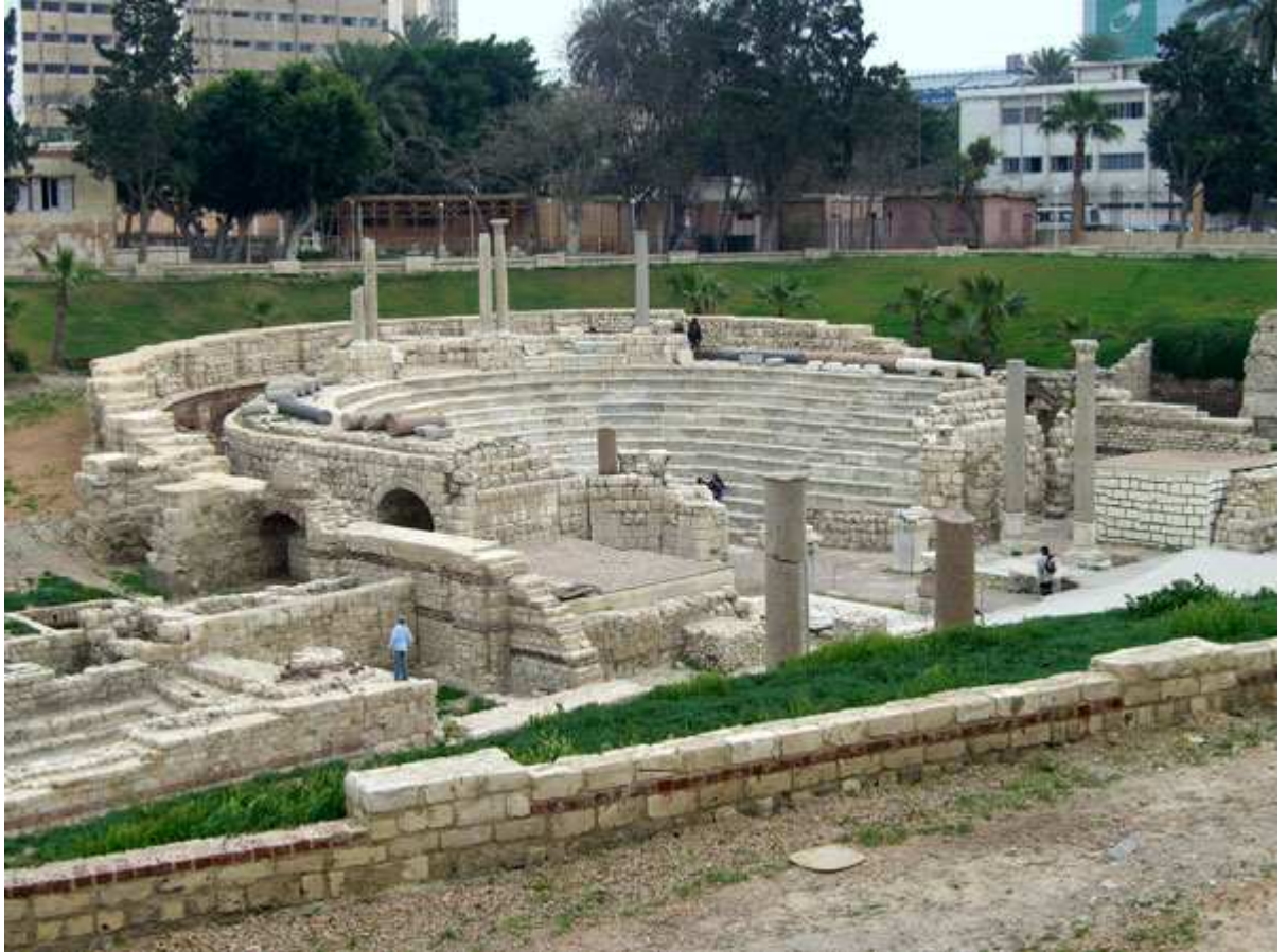
Figure 4 : Le théâtre romain de Kôm ed-Dikka, Alexandrie, Egypte

Le théâtre romain de Kôm ed-Dikka 25 "contient environ 800 places. Daté de la fin du II e siècle, il a sans doute été transformé en amphithéâtre et réaménagé trois siècles plus tard à des fins religieuses. Une mission archéologique de l'Université de Varsovie découvrit en 1964 ce petit théâtre (fut-il un odéon ?) Avec douze gradins de marbre en demi-cercle, à la suite de la démolition des restes d'un fort napoléonien. C'est ici pratiquement le seul exemple de théâtre romain en Égypte. Les fouilles continuent."