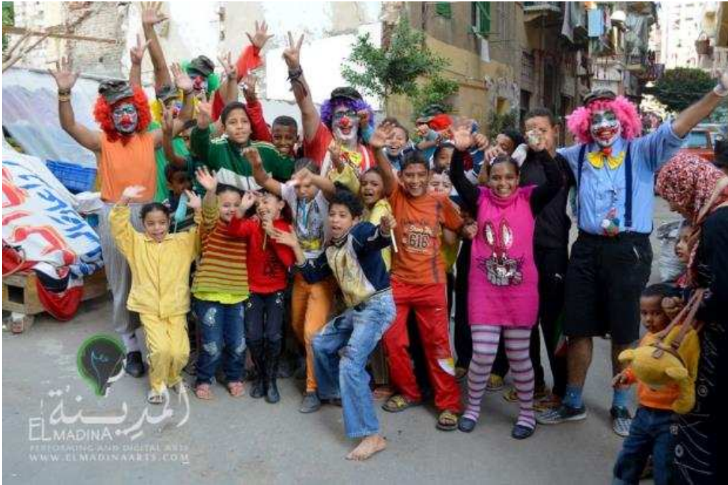
Figure 2 Photos de quelques prestations du " théâtre indépendant"

Photos de quelques prestations du théâtre indépendant