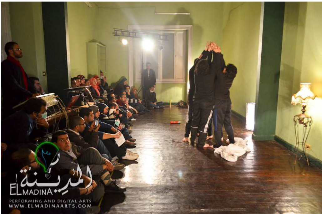
Photo : représentation théâtrale par un groupe indépendant en formation à l'association El Madina,

2012.