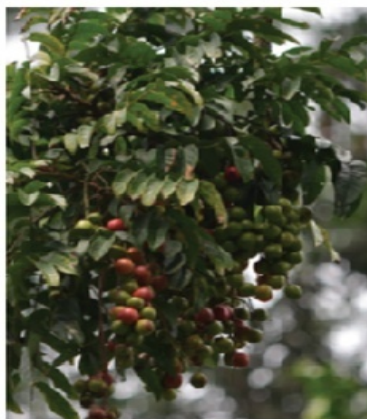
Figure 1: Feuilles et fruits de Pseudospondias microcarpa (A. Rich) Eng

Les fruits mûrs de Pseudospondias microcarpa (figure 1) ont été récoltés au bord du fleuve Kouyou à Owando, dans le département de la Cuvette centrale, situé au nord du Congo. Les fruits ont été dépulpés et les graines ont été séchées à l'abri de la lumière et à la température ambiante au sein de l'Unité de Chimie du Végétal et de la Vie (UC2V) dont le siège est la Faculté des Sciences et Techniques de l'Université Marien Ngouabi (Brazzaville-Congo).