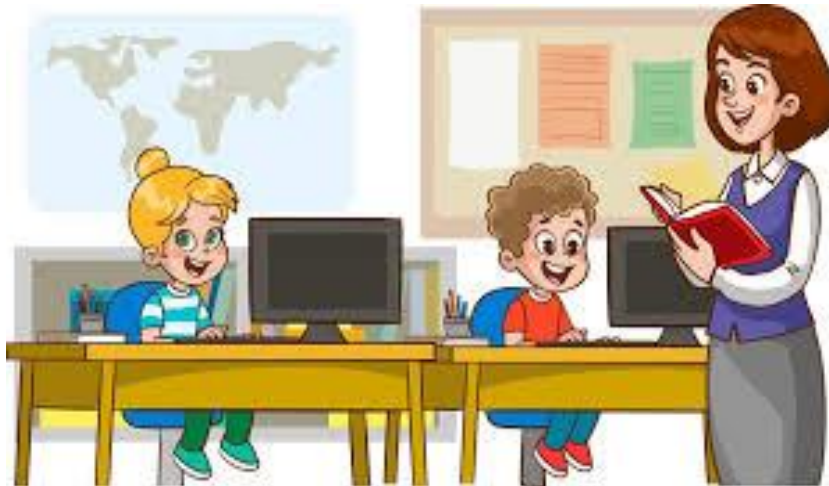
Figure 1: enseignante en classe au primaire

"L'enseignant est un professionnel réflexif, qui analyse constamment sa pratique, innove et s'adapte pour répondre aux besoins spécifiques des élèves qu'il accompagne."