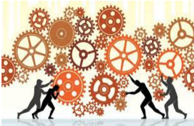
Figure 2: illustration de la complexité du travail

"Le travail est une condition fondamentale de l'existence humaine, qui permet la production de biens de consommation et la satisfaction des besoins essentiels."