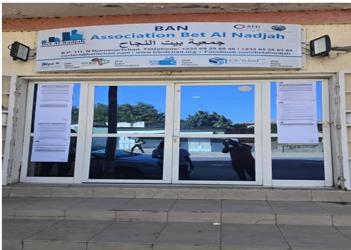
Figure 1: Maison de la petite entreprise