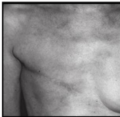
Figure 3 : Cicatrice d'une mastectomie latérale (Zelek, 2007)