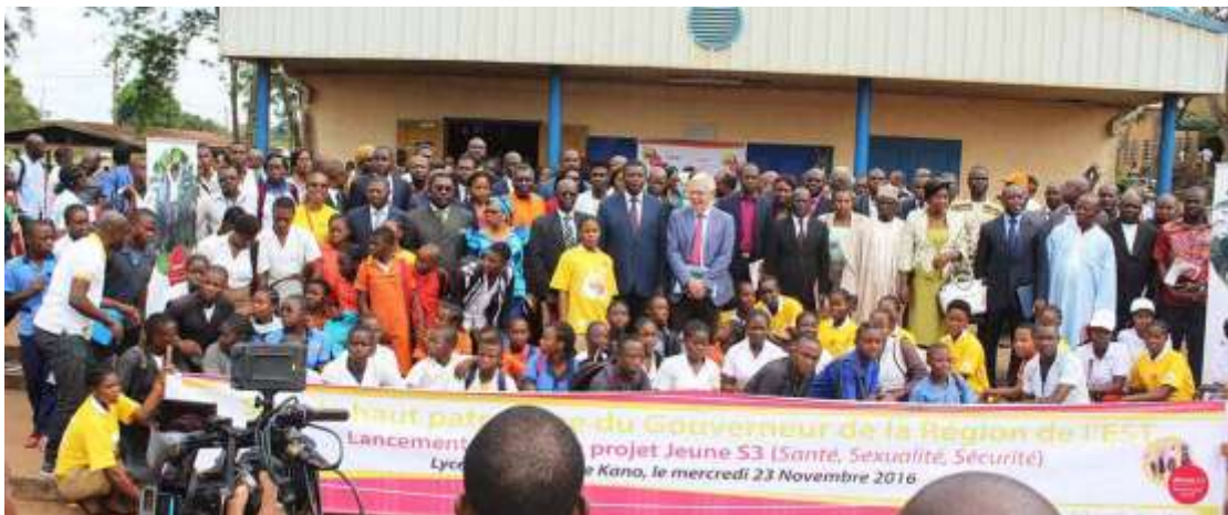
Photo 2: Lancement du projet Jeune S3 à Bertoua au lycée technique de Kano

Le projet Jeune S3 (Santé-Sexualité-Sécurité) [est] mis en œuvre au Cameroun par l'Association Camerounaise pour le Marketing Social (ACMS). Son but est de permettre aux jeunes d'avoir facilement et librement accès aux services en Santé Reproductive tout en faisant respecter leurs droits.