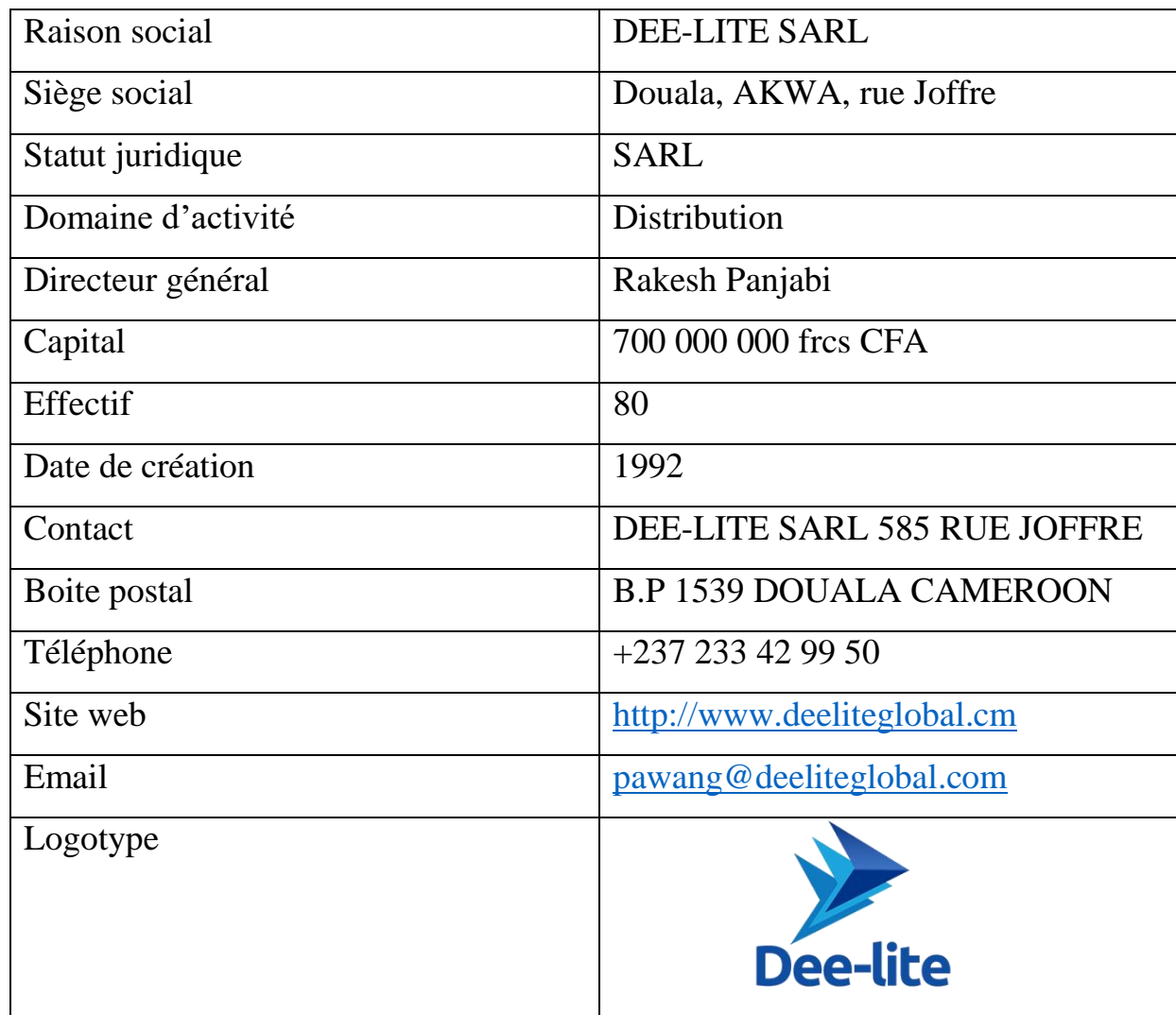
Tableau 2: Fiche signalétique